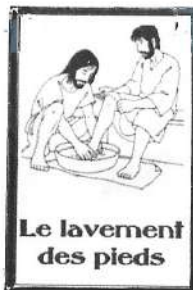
Le lavement des pieds

Le Jeudi Saint . La veille de sa passion, Jésus a lavé les pieds de ses amis avant de partager son dernier repas avec eux. C'était une manifestation d'humilité et de service. Puis il a pris du pain, l'a rompu et a dit « ceci est mon corps, donné pour vous. Faites ceci en mémoire de moi ». Il a fait de même avec la coupe de vin.