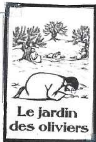
Le jardin des oliviers