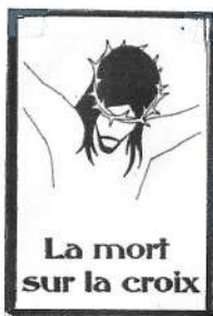
La mort sur la croix

La Passion du Vendredi Saint . Après le repas, Jésus est parti prier, de nuit, au jardin des Oliviers. Il savait que Judas l'avait trahi en indiquant aux soldats où le trouver. Les chefs religieux lui ont reproché de « se prendre » pour le fils de Dieu. Jésus a été condamné à être crucifié , il est mort sur la croix.