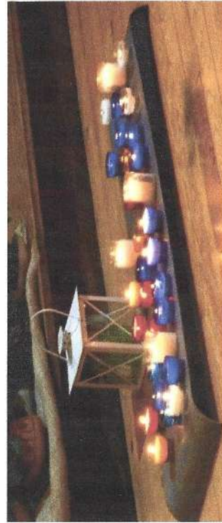
Lumière de Bethléem

Paroisse Notre Dame de l'Espérance 13, contour de l'église 59930 LA CHAPELLE D'ARMENTIÈRES Tel : 03 20 35 30 10 notredamedetesperance@laposte.net Site : https://lachapelle.armentierois.fr/