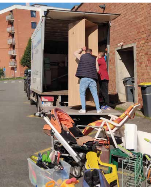
Le chargement des gros meubles.