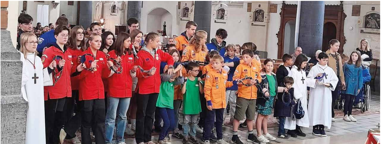
Bénédictio des cartables.

Notre paroisse Notre-Dame de l'Espérance s'engage cette année à « marcher ensemble » dans la foi et la communion fraternelle. Ce thème nous rappelle que nous sommes tous pèlerins sur le chemin de la vie, appelés à nous soutenir et à avancer ensemble avec le Christ comme guide.